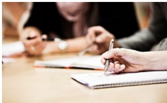
Figur 29. Utredning om risker.