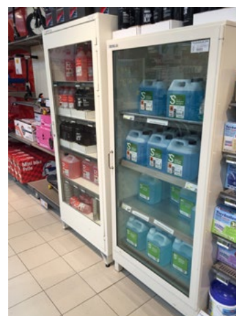
Figur 22. Skåp testat och certifierat enligt SP 2369 version 1-5, märkta SP2369 klass 1.