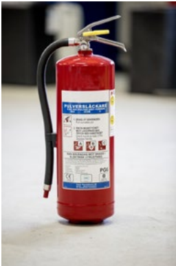
Figur 15. Pulversläckare.

Det är viktigt att hålla instruktionerna aktuella och uppdatera dem vid förändringar i verksamheten. Det är också viktigt att utföra egenkontroller regelbundet för att säkerställa efterlevnaden av instruktioner och rutiner.