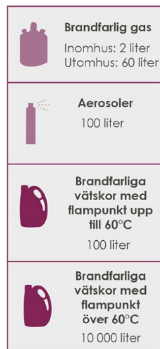
Figur 28. Volymer som är undantagna tillståndsplikt i butiker.

Samma krav ställs på hanteringen av brandfarliga gaser och vätskor oavsett om den är tillståndspliktig eller inte.