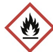
Figur 13. Varningsskylt brandfarlig vara 21 .