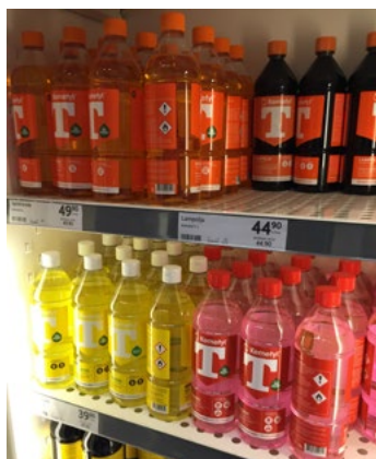
Figur 20. Förvaring i brandavskiljande skåp.

Vid placering i brandavskiljande skåp behövs i allmänhet inget avstånd till lättantändligt material (se avsnitt 2.2.1), till utrymningsvägar (se avsnitt 2.2.2) eller till varor med andra faror (se avsnitt 2.2.3). För att motverka risken att brandfarlig vätska rinner in under skåpen