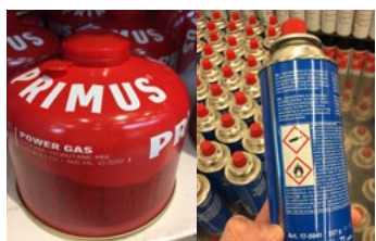
Figur 7. Två exempel på gasolbehållare.

Brandfarliga gaser är sådana gaser som kan antändas vid 20 °C, alltså runt normal rumstemperatur och normalt lufttryck. Gasol (propan, butan eller blandningar av dessa) är den vanligast förekommande gasen i butiker. Gasolen finns både som mindre engångsbehållare för till exempel gasbrännare och campingutrustning, och i större gasolflaskor för till exempel gasolgrillar och husvagnar. Gasol används även för påfyllning av cigarettändare. Gasol är i vätskefas (kondenserad) inuti en behållare, men räknas ändå som en gas, eftersom den förångas till gas när den kommer ut i luften.