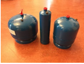
Figur 16. Gasolbehållare med volym 1-5 liter.