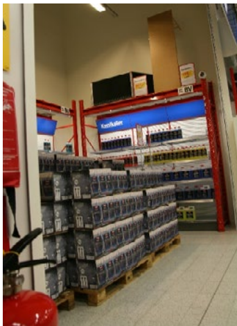
Figur 26. Butiksutrymme avskilt med jalousi.

Exempel på brandtekniskt avskilda utrymmen kan vara rum eller utrymme med dörrar eller jalousier som stänger automatiskt vid brand. Observera att även utrymningsmöjligheter måste säkerställas för denna typ av utrymmen.