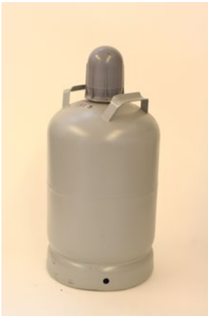
Figur 27. Gasolflaska av typ P11 som rymmer 26 liter.

För större mängder än vad som anges i tabell 2.1 och för större behållare än tillåtna (se avsnitt 2.1.1) är det lämpligt att flytta behållarna utomhus eller till ett förvaringsutrymme avskilt från butiksbyggnaden, till exempel en separat byggnad, container, plåtskåp eller liknande, för att uppnå en säker placering. Då kan avstånd till både butiksbyggnaden och andra verksamheter behövas, se avsnitt 2.7.1. Det är också viktigt att ta hänsyn till trafiksituationen och se över behovet av påkörningsskydd, se avsnitt 2.6.3. Vid samförvaring av brandfarlig gas eller aerosoler och brandfarlig vätska i utrymmet gäller avsnitt 2.5.3. Inget lättantändligt material får förvaras i utrymmet. Om det bara gäller större behållartyper än enligt avsnitt 2.1.1 kan det dock vara tillräckligt att de förvaras otillgängliga för allmänheten.