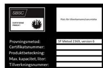
Figur 21b. Texten SP Metod 2369 version 6 visar att skåpet är godkänt för samförvaring.