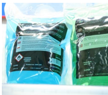
Figur 6. Olika typer av spolarvätska.

Spolarvätska säljs ibland i plastpåsar. Dessa är mer ömtåliga än plastflaskor, och kan spricka redan vid fall från höjder strax över en meter.