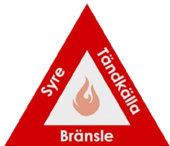
Figur 1. Brandtriangeln visar vad som behövs för att en brand ska kunna starta.

Handboken omfattar inte explosiva varor, även om sådana kan förekomma i butiker i form av till exempel fyrverkerier. För information om hantering av fyrverkerier i butiker, se MSB:s skrift Försäljning av fyrverkerier 4 .