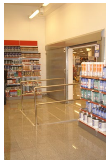
Figur 24. Brandtekniskt avskilt försäljningsutrymme.