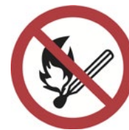
Figur 12. Förbudsskylt mot rökning och öppen eld 20 .

Det behövs normalt ingen särskild ventilation för utrymmen i skåp med en begränsad förvaring av fabriksförslutna oöppnade förpackningar eftersom risken för läckage är mycket liten. Risken för att de oöppnade förpackningarna ska läcka i samband med den dagliga hanteringen i skåpen är väldigt liten. Risken för att de ska läcka i skåpen vid en olycka i samband med att en behållare sätts in eller tas ut ur skåpen är även den väldigt liten. Om man skulle tappa en behållare är det mer sannolikt att spillet hamnar utanför skåpet än i skåpet.