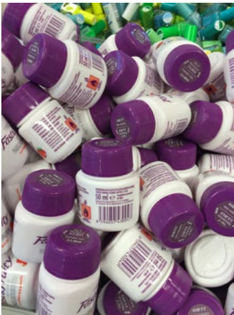
Figur 17. Exempel på små behållare med 50 ml brandfarlig vara.