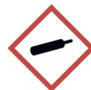
Figur 14. Varningsskylt för gasflaska, gas under tryck 22 . Skylten ska där gasflaskor förvaras kompletteras med tilläggs texten "Gasflaskor - förs i säkerhet vid brandfara".