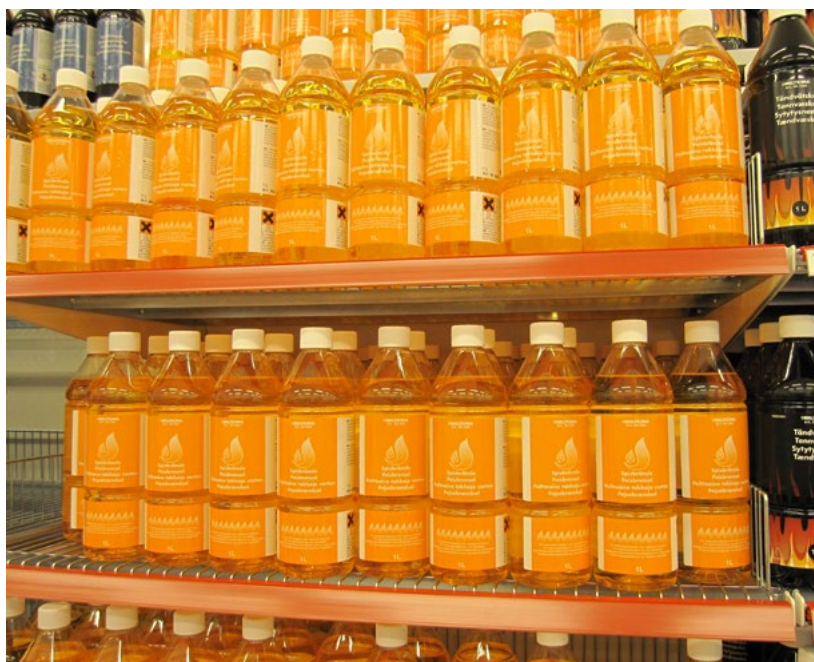
Figur 2. Exempel på brandfarlig vätska med olika flampunkter: spisbränsle respektive tändvätska.