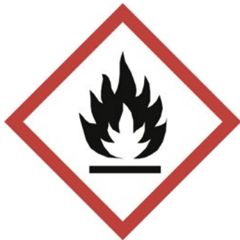
Figur 10. Flamman, varnings- skylt för brandfarlig vara 14 .