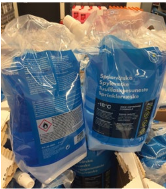
Figur 18. Exempel på behållartyp som kan spricka redan vid fall från låg höjd.