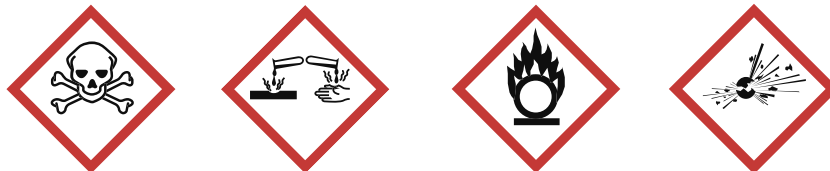
Figur 19. Märkning av produkter med giftigt, frätande respektive oxiderande innehåll, samt explosiva varor.

I butiken är det tillräckligt om brandfarliga vätskor placeras minst 6 meter från behållare med brandfarlig gas, aerosolbehållare med brandfarligt innehåll samt behållare med giftigt, frätande eller oxiderande innehåll. Om de brandfarliga varorna står placerade i brandavskiljande skåp (se avsnitt 2.3) behövs i allmänhet inget avstånd.