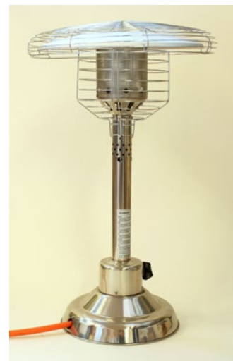
Figur 30. Gasolvärmare som exempel på en gasanordning.

Märkningen ska vara varaktig och läsbar. Varningstexter ska vara lättlästa och på svenska.