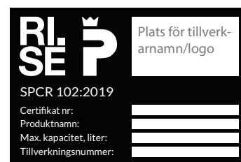
Figur 21a. Texten SPCR 102:2019 visar att skåpet är godkänt för samförvaring.

Skåp som är provade enligt standarden SS-EN 14470-1 är endast avsedda för förvaring av brandfarlig vätska. I sådana skåp ska inte aerosolbehållare eller behållare med brandfarlig gas placeras.