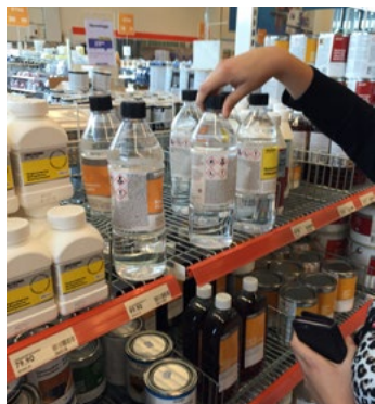
Figur 5. Olika typer av förpackningar.