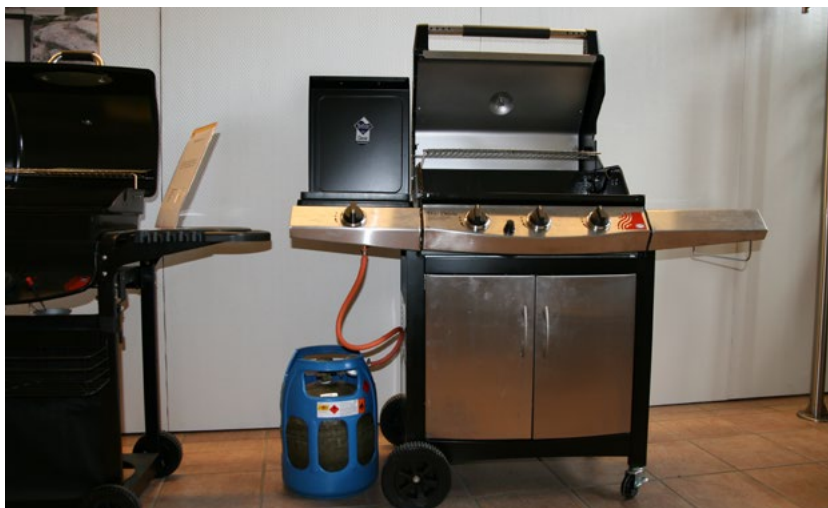
Figur 31. Gasogrill som exempel på gasanordning.