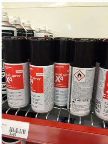
Figur 23. Aerosoler på trådhyllor som effektivt släpper igenom sprinklervatten.

Automatiska släcksystem kan vara ett effektivt sätt att skydda brandfarliga varor mot brand i en butik, särskilt om branden uppstår i närheten. Förekomsten av ett automatiskt släcksystem har alltså stor påverkan på hur en eventuell brand utvecklas och hur de brandfarliga varorna kan påverkas och beskrivs därför närmare här. Det är viktigt att både släcksystemet och placeringen av brandfarlig vara utformas på rätt sätt. Därför kan en utredning behöva visa att släcksystemet har avsedd effekt. I lokaler med befintliga släcksystem behöver man utvärdera om dessa ger rätt skydd för brandfarlig vara. Går det inte att visa att släcksystemet är en effektiv skyddsåtgärd så bör man inte heller kunna återopa dess skydd i sin utredning om risker.