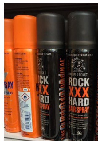
Figur 9. Aerosolbehållare.